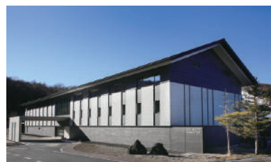
MAP D-1 高峰マウンテンホテル

☎ 0267-25-2000 🏠 小諸市菱平高峰高原704-1 📄 標高2,000mの展望風呂はまさに絶景！内湯「ランプの湯」の源泉槽かけ流し36℃と加熱層41℃を交互入浴することにより、肩こり・腰痛・自立神経のバランスを整えてくれます。 ※日帰り入浴はランプの湯のみ 🕒 日帰り温泉情報 🕒 11:00~16:00 📅 なし 🎫 4月末頃~11月中旬:大人 500円 / 小学生以下 400円 11月中旬~4月末頃:大人 1,500円 / 小学生以下 1,000円