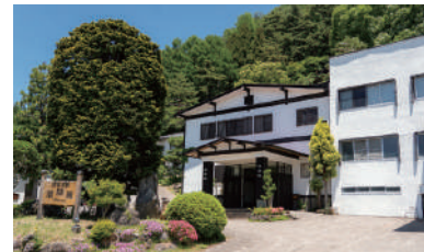
MAP C-3 菱野温泉 薬師館

☎ 0267-23-5732 🏠 小諸市塩野3876-4 📄 標高1,000mの浅間山麓に位置し、周囲をカラマツの林、高原野菜の畑に囲まれた環境。週末毎にイベントやツアーを実施をしています。ご希望に応じて平日も実施します。