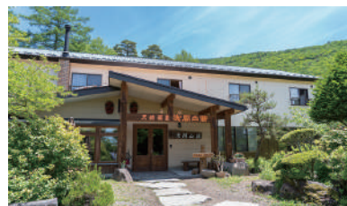
MAP D-2 天狗温泉浅間山荘

☎ 0267-22-0516 🏠 小諸市菱平476-2 📄 名物の登山電車に乗って1分半、絶景の展望露天風呂「雲の助」に到着。標高1,050メートルの浴槽から望むハケ岳、富士山、佐久平の大パノラマは美しく、爽快そのものです。季節折々の風情をお楽しみください。 🕒 日帰り温泉情報 🕒 11:00~16:00 📅 なし 12月~3月20日までは火・水曜日 🎫 展望露天風呂「雲の助」中学生以上 1,500円 / 3歳~小学生 750円 館内大浴場 中学生以上 500円 / 3歳~小学生 250円