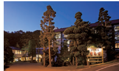
MAP B-3 菱野温泉 常盤館

☎ 0267-22-0077 🏠 小諸市菱野740 📄 開泉800年の歴史を持つ菱野温泉郷にある老舗旅館。石窟を抜けると、薬師池に浮かぶ「浮鳥風呂」があります。温度が異なる3つの浴槽に順番で浸かる入浴法で、身体のみまで温まります。 🕒 日帰り温泉情報 🕒 11:00~21:00 📅 火曜日 12月~3月20日までは火・水曜日 🎫 大人 600円 / 小学生以下 500円 / 3才未満 無料