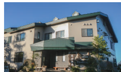
MAP C-1 高峰温泉 ランプの宿

☎ 0267-25-3000 🏠 小諸市高峰高原704 📄 標高2,000mの眺望ロケーションのホテル。温泉、食事、さらには客室からも絶景を楽しむことができます。浅間山登山や高峰高原散策の帰りにご利用いただけるレストラン・カフェもあります。 🕒 日帰り温泉情報 🕒 11:00~18:00 📅 なし 🎫 4~11月:大人 800円 / 小学生以下 500円 / 3才未満 無料 12~3月:大人 500円 / 小学生以下 300円 / 3才未満 無料