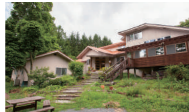
MAP D-4 小諸ユースホステル

浅間・高峰エリアには、温泉が楽しめる宿泊施設がたくさんあるのをご存知ですか？ 目の前に広がる大自然を感じながら浸かる温泉は格別！多彩な泉質でお肌もぶるぶる。 お時間にゆとりがある方は宿泊がオススメ。温泉とご当地グルメで浅間・高峰を満喫！