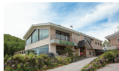
MAP D-1 高峰高原ホテル

☎ 0267-22-0959 🏠 小諸市甲又4766-2 📄 天狗温泉はその昔、天狗が温泉に入ったために温泉の色が赤くなったという伝説をもつ、源泉かけ流しの温泉。弱酸性の優しいお湯で、肌はぶるぶる、身体もポカポカ。登山口にあるので立ち寄りやすいのがポイント！ 🕒 日帰り温泉情報 🕒 11:00~17:00 📅 なし 🎫 大人 800円 / 小学生以下 500円 3以上~ 5才未満 350円 / 3才未満 無料